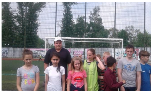
Мастер-класс по обучению игры в футбол