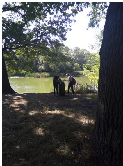
Акция «Чистый берег»