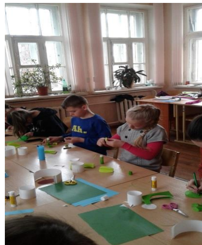
Мастер-класс «Нетрадиционные техники рисования»