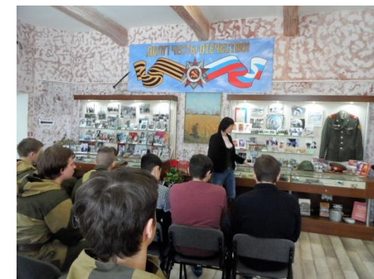
Музейный урок «Афганское эхо»