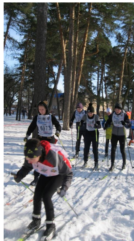
Акция «Спорт как альтернатива пагубным привычкам»