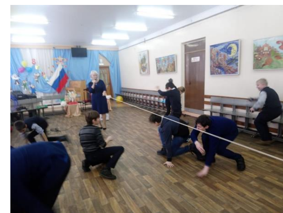
Развлекательный досуг «23+8»