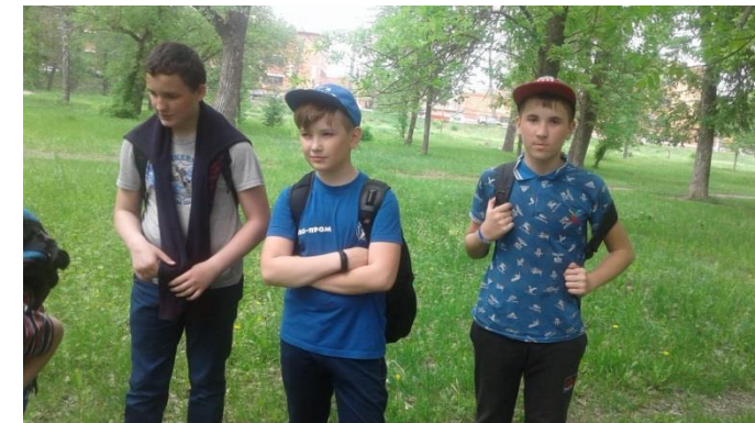
Поход выходного дня